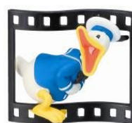
04かしこいメンドリ(1934)