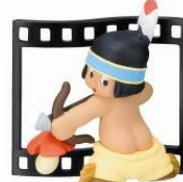
07小さなインディアン ハイアワサ(1937)