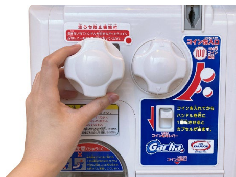
ガチャマシンのハンドルとほぼ同じサイズ

『THE！ガチャハンドル』は、当社が現在店頭で展開しているガチャマシン「ガチャ2Ez(イージー)」のハンドル部分をほぼ同じ大きさで再現したもので、実際につかんで回すことができます。その際、本物のマシンと同じように「カチカチ」とした音が鳴ることが特長です。本体内部に小さなパーツを噛み合わせることで、ガチャマシンのハンドルを回したとき特有の音と感触を再現しました。