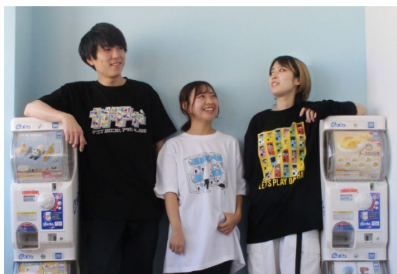
「レッツプレイガチャ®プロジェクト」第1弾 『ガチャ® Tシャツ』