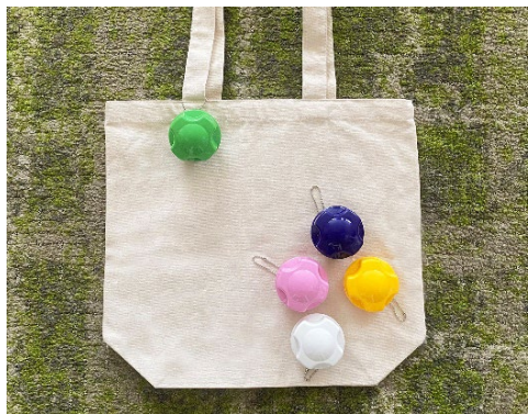
ボールチェーン付きで持ち歩きが可能

カラーは「ガチャ2EZ」の実機の中から5色をセレクトしています。また、本体にはボールチェーンが付いており、お手持ちのバッグやポーチなど好きな所に着けて持ち歩くことができます。