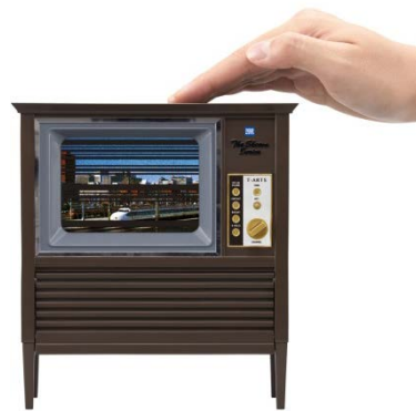
砂嵐手振動修復方式