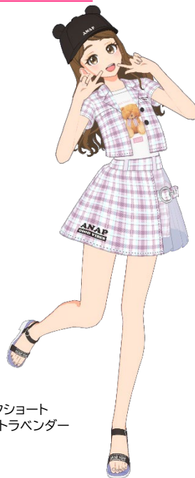
▲チエックショート ジャケットラベンダー