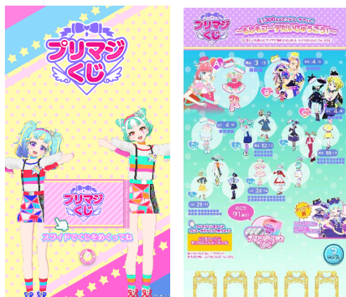
▲プリマジくじプレイ画面

3月16日(木)からは、『プリマジスタジオ』内に「プリマジくじ」が新たに登場します。ユーザーはテーマに沿ったコーデのラインアップの中から、くじで当たったコーデをフルコーデで購入することができます。スタジオ第4章プリマジくじのテーマは、「もしもコーデだいしゅうごう!」。“もしもプリマジスタがマナマナだったら…”など、夢のあるコーデが揃っています。