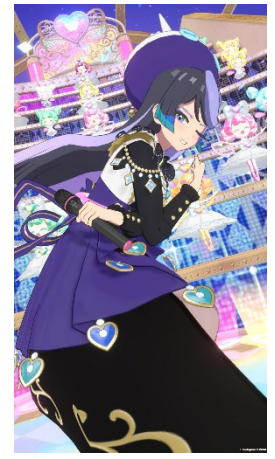
きゃろん(CV:吉河 順央) れもんのパートナーの魔法使い! 礼儀正しくてまじめ。だけど融通がきかない。

2022年11月2日(水)に稼動開始したアミューズメントゲーム『ワッチャプリマジ! スタジオ』(以下『プリマジスタジオ』)は、これまで展開していた『ワッチャプリマジ!』がバージョンアップしたものになります。「わたしが主役」をコンセプトに、これまで以上に「マイキャラ」にフォーカスした音楽スタジオのようなスタイルで、「マイキャラ」を通じてまるで自分の分身がゲームの中に入り込んでいるようなメタバース的な体験ができることが特長です。