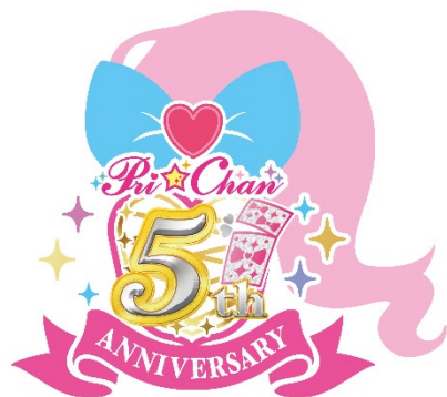
▲『キラッとプリ☆チャン』5周年ロゴ

『プリマジスタジオ』スタジオ第4章に、3月30日(木)より『キラッとプリ☆チャン』の主人公「みらい」と友だちの「だいた」とのペア楽曲「MEMORIES FOR FUTURE」が追加になります。また「みらい」の象徴的なコードである「スイートハニーキラッとコード」がカードとしてゲーム筐体から配出されるなど、様々な施策で『キラッとプリ☆チャン』5周年を盛り上げてまいります。