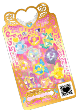
▶プリ☆チャンコラボのプリマジプロフカードデザイン