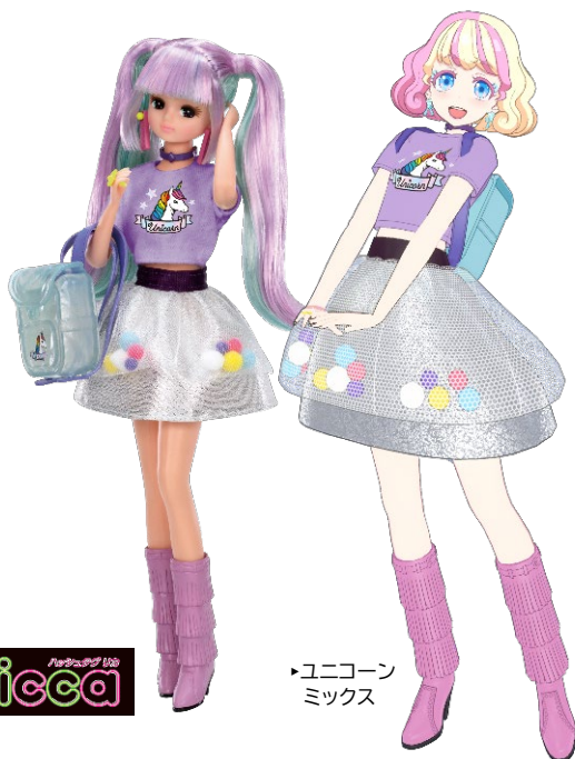
▶ユニコーン ミックス