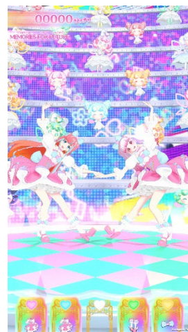
▲「MEMORIES FOR FUTURE」プレイ画面