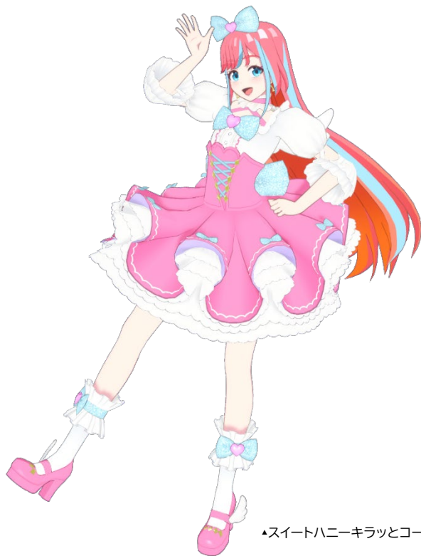
▲スイートハニーキラッとコード