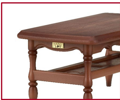
真鍮製プレートや隠れミッキーも再現