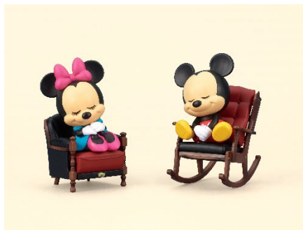
お手持ちのフィギュアを乗せることもできます

お気に入りの家具と一緒に飾ったり、フィギュアを乗せて写真を撮ったり、様々な楽しみ方ができる『カリモク OTONA Disney Style ガチャ®コレクション』。手のひらサイズの小さなディズニーインテリアをじっくりと味わって下さい。